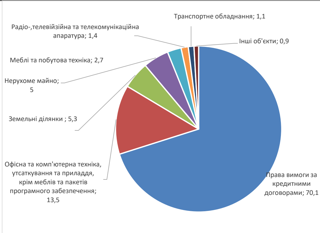
Рис. 1. Класифікація об'єктів аукціонів, та їх частки, %