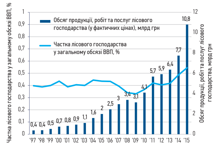
Рис. 1. Динаміка використання лісу та його частка у ВВП (1997-2015)

За I пів. 2016 року реалізовано промислової продукції (товарів, послуг) на 796,6 млрд грн. Частка категорії “Виготовлення виробів з деревини, виробництво паперу та поліграфічна діяльність” становить 3,5% (27,9 млрд грн), з яких 35% продукції виробів з деревини експортувалось. Виробництво меблів та іншої продукції становить 1,6% від загального обсягу реалізованої промислової продукції, де практично половина виробів експортувалася.