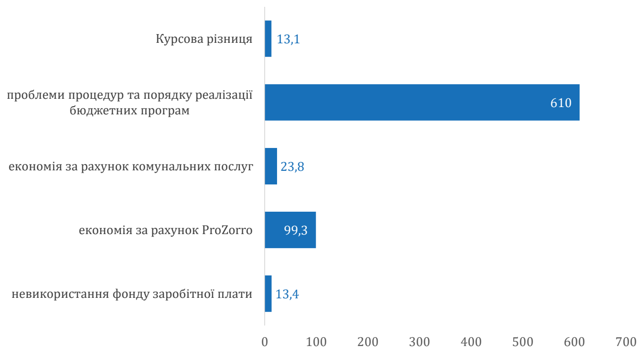
Рис. 2. Обсяг невикористаних коштів за бюджетними програмами відповідно до п'яти причин, які найчастіше зазначали ГРК, млн грн